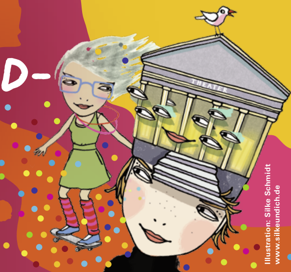
Illustration: Silke Schmidt www.silkeundich.de

20. März – Welttag des Kinder- und Jugendtheaters